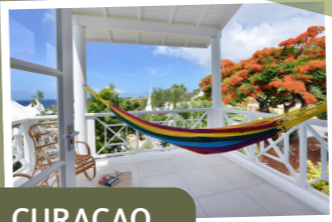
CURAÇAO JAN THIEL CHOGOGO RESORT