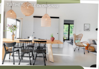
DEUTSCHLAND OSTSEE – DE OLE SCHOOL TEGERNSEE – ALPENSONNE