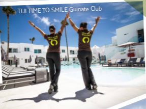
SPANIEN GRAN CANARIA – TARA TENERIFFA – OHASIS FUERTEVENTURA – COCCOLOBA