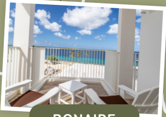
BONAIRE KRALENDIJK CHOGOGO RESORT